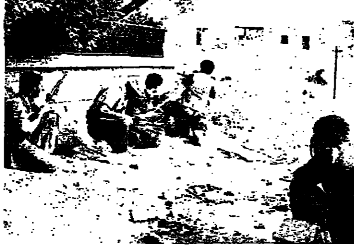
مسجونون على طريق المطار

وصف السيد منح الصلح اشتباكات المخيمات في بيروت وضاحيتها بأنها مظهر ترويدي وعجز في الساحة السياسية للمنطقة الغربية. وقال من المزمع ان تقول نظريا بين شعبين شقيين ولا يتنكس ذلك في التطبيق.